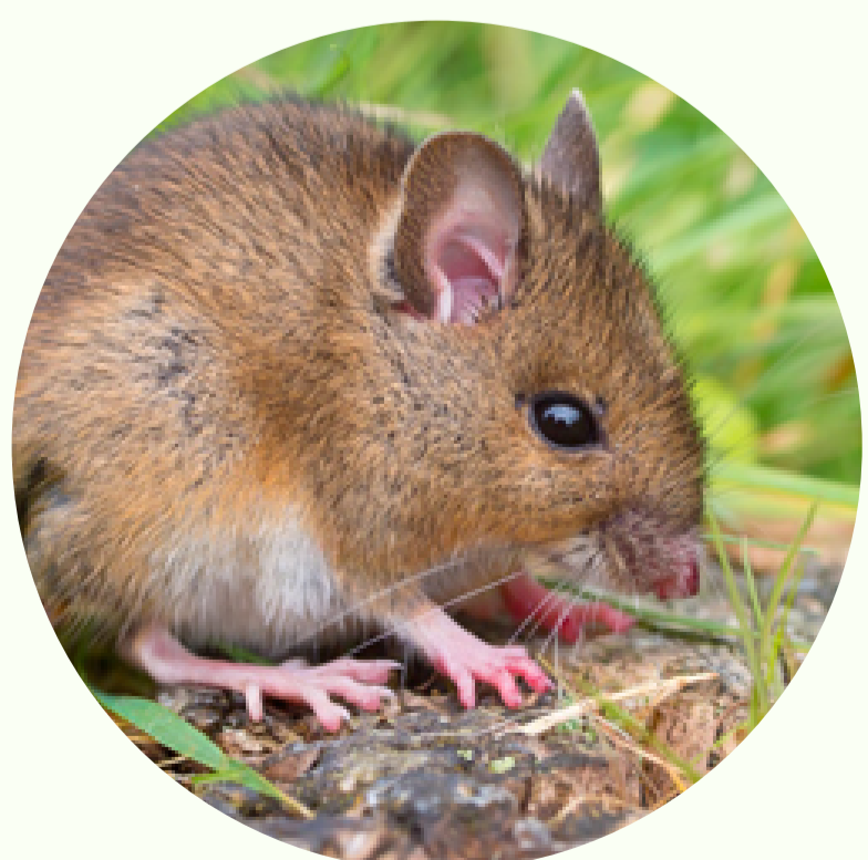
Ratón de Campo