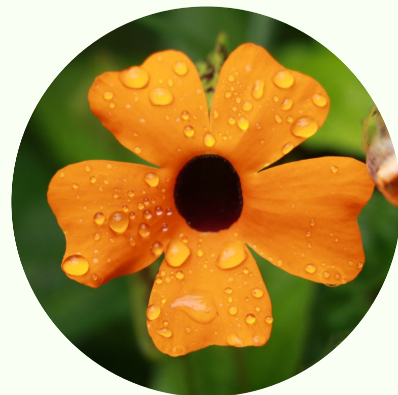
Ojo de Poeta