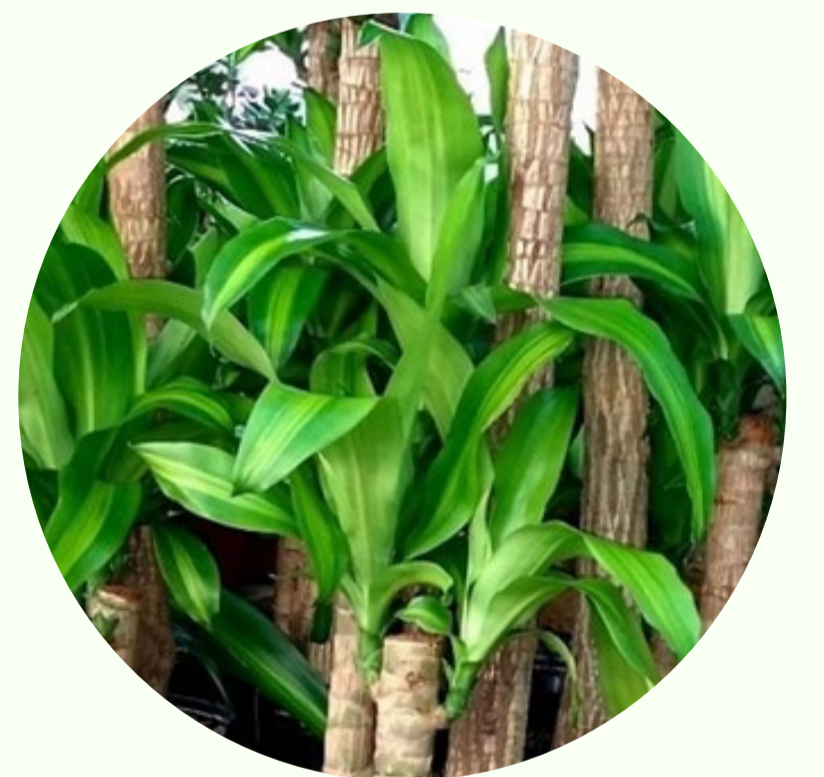
Palo de Agua